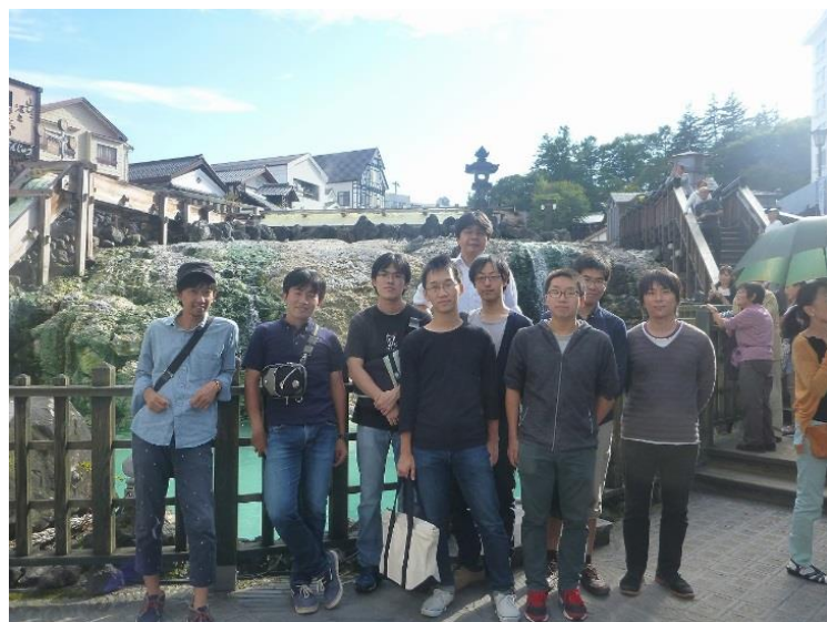
↑湯畑にて集合写真

9月28～29日に研究室旅行で草津に行きました。1日目には湯畑と西の河原の観光をし、温泉と地元の食材を使った料理を堪能しました。2日目には品木ダムとハツ場ダム(工事中)を見学し、ダム工事や事業について学びました。