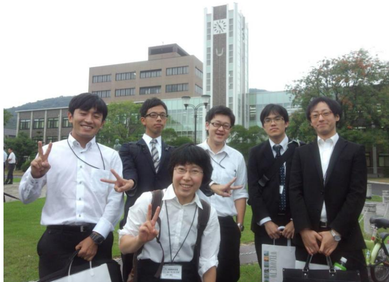
二羽研も一緒に写真撮影

2日目の午後は時間があつたので岡山城、後樂園、倉敷の美観地区を観光しました。岡山城ってほとんどが鉄筋コンクリート製なんですね…。