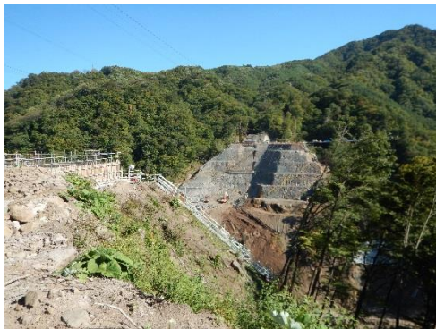
ハツ場ダム工事。スケールの大きさに圧倒されました。↑→