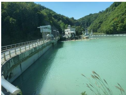
↑品木ダム。酸性の河川水の中和事業を行っています。