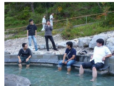
↑足湯が気持ち良かったです。研究室の机の下にほしい…