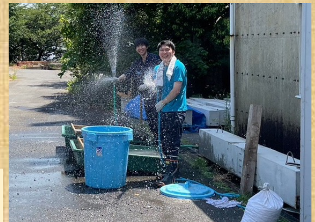
まだまだ暑い日が続きますが元気に過ごしましょう！ Let's stay healthy in the hot weather!