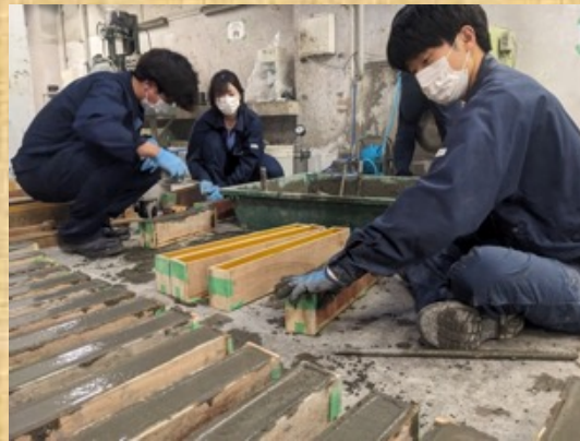
実験をみんなで手伝っています！ Everyone is helping with the experiment