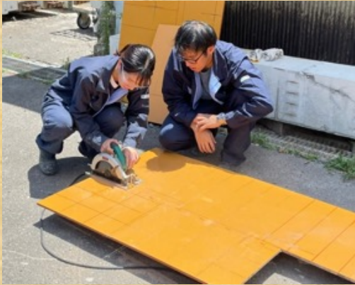
暑い中頑張ってますね！ Everyone was doing a great job in the heat!