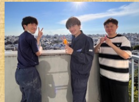
実験お疲れ様でした！！ Keep up the good work!