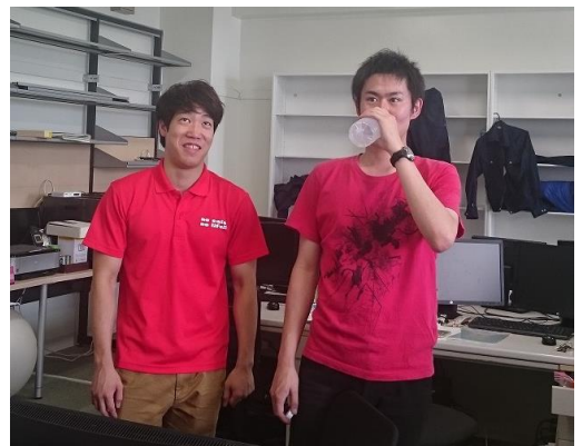
曾川とかぶる小田切(無理矢理感)