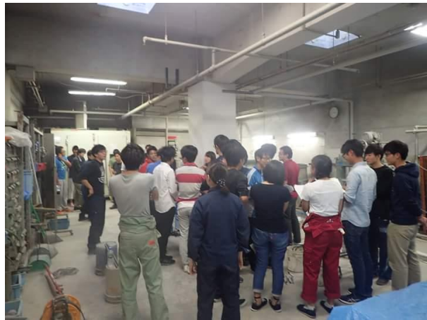
学生実験も始まりました。