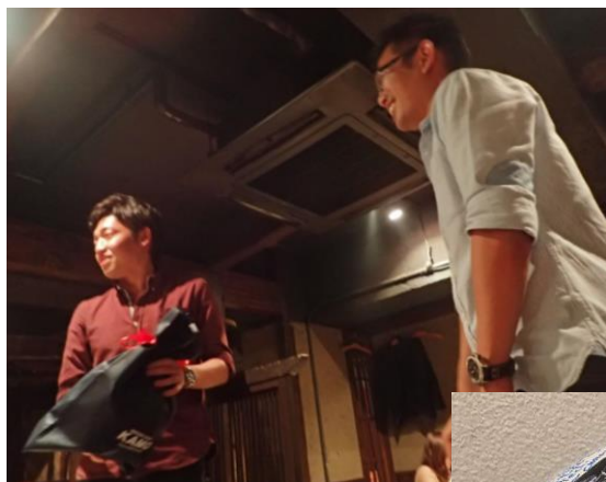
Chaさんへの プレゼントは 寄せ書きサッカー ボール！