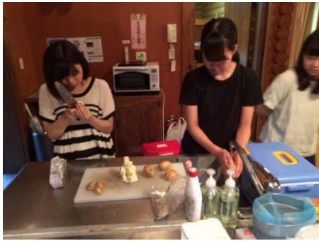
じゃがバター始めました。