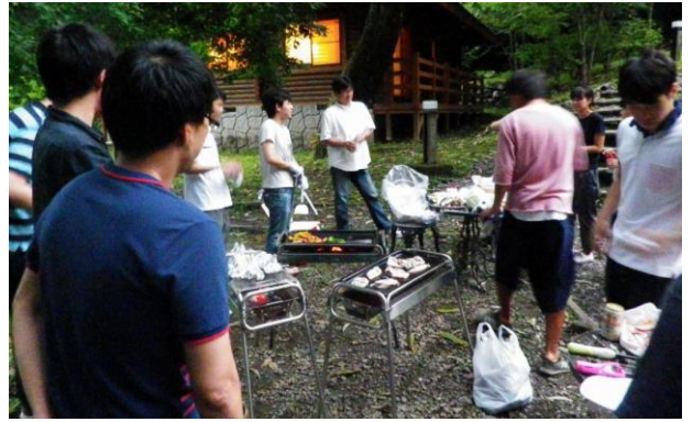
人数も増えましたね…