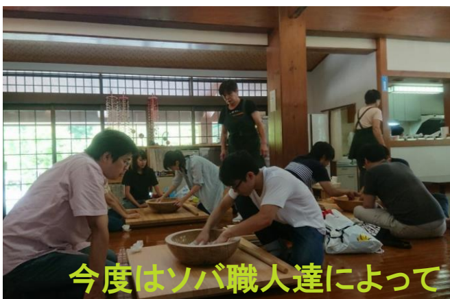
今度はソバ職人達によって