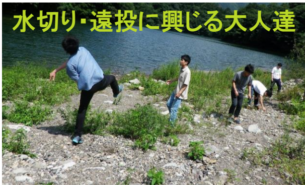
水切り・遠投に興じる大人達