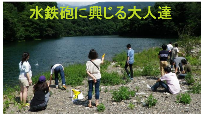
水鉄砲に興じる大人達