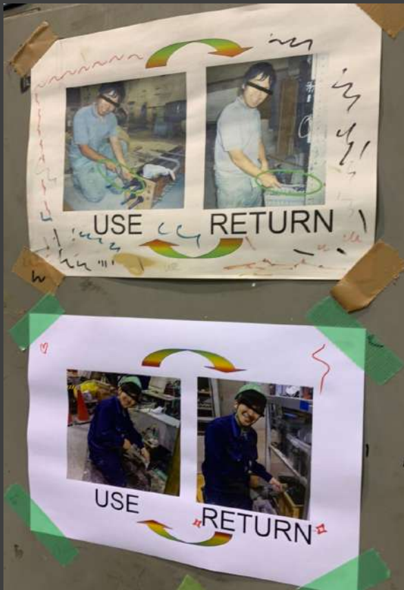
Renewal of alert poster “Return after use”